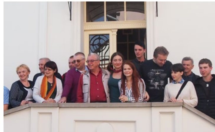
• Vojan před Českým domem ve Virovitici

Zájezd libických ochotníků začal ve čtvrtek 28. září ve vesnici Končence, děti ze zdejší české školy zhlédly zmíněnou pohádku a odměnily herce dlouhým vděčným potleskem. Komedie Nevěsta