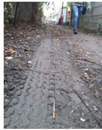
odborné sociální poradenství, primárně zaměřené na ty, kdo

usilují o změnu své životní situace, a také pro jejich osoby blízké. Na Centrum adiktologických služeb se tak mohou obracet rodiče či jiné osoby blízké, které mají u svých dětí/známých podezření na užívání drog a chtějí se poradit, jak v této nelehké situaci postupovat. Centrum je možné kontaktovat na telefonních číslech 734 316 541 (kontaktní centrum) nebo 724 557 504 (terénní výjezdy) každý všední den od 9 do 17 hodin nebo emailem cas.nymburk@laxus.cz. Veškeré služby jsou poskytovány zcela zdarma a anonymně.